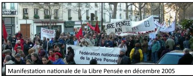
Manifestation nationale de la Libre Pensée en décembre 2005

Le rassemblement de la Libre Pensée à Abbeville sera la première étape de la mobilisation pour faire échouer les attaques contre la loi de 1905.